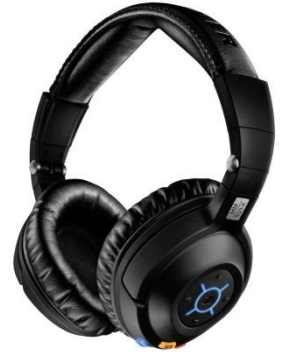
全封闭数字无线耳机